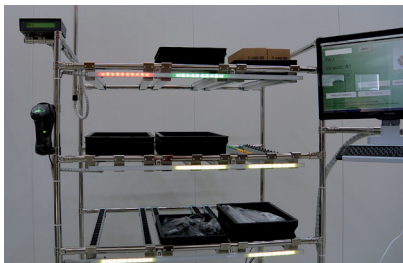
Tuotteiden siirtäminen varastossa on helppoa.